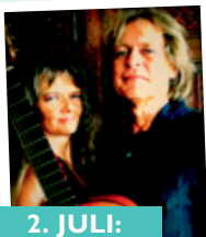
2. JULI: Blond Gypsies