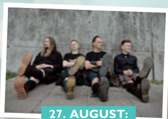
27. AUGUST: The Baltic Scots